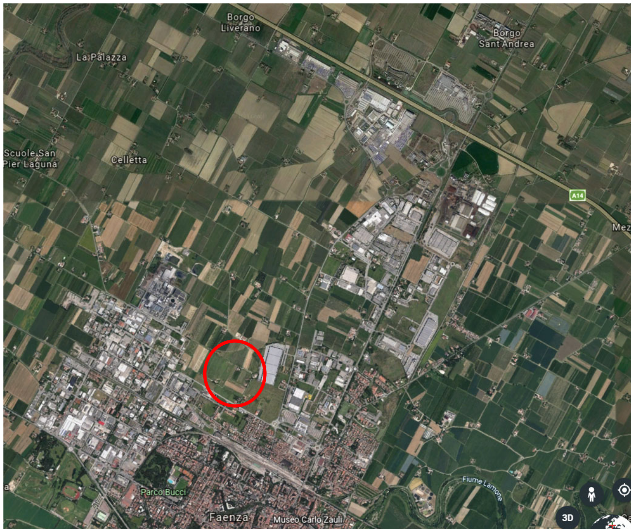
Google Earth a grande scala