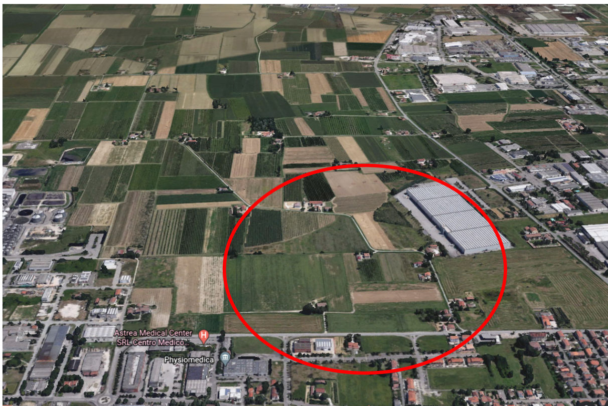
Google Earth Vista 3D