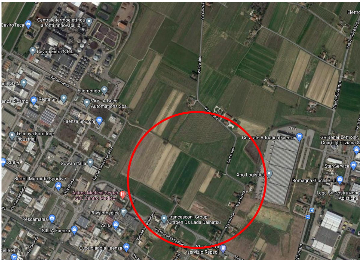
Google Earth a media scala