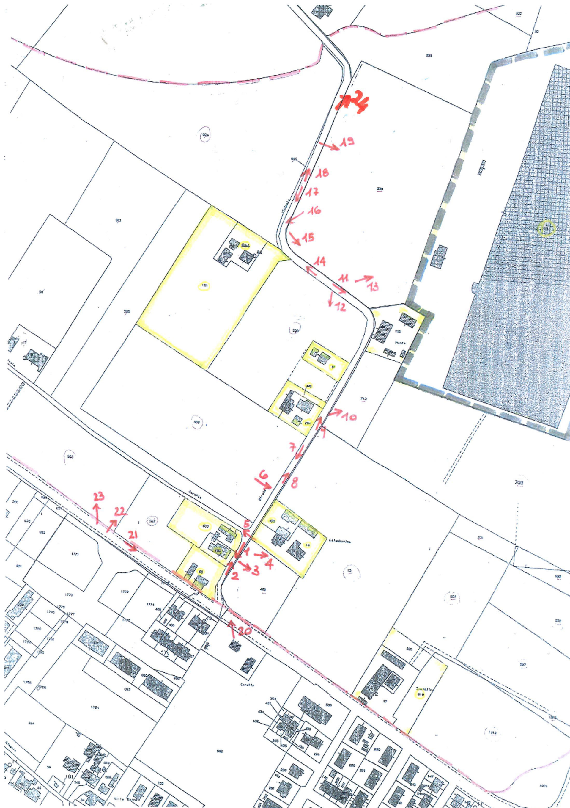
Punti di Vista Fotografici